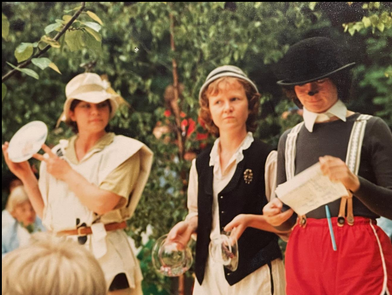
Glassblåserne som har bidratt til å gjøre Berger kjent