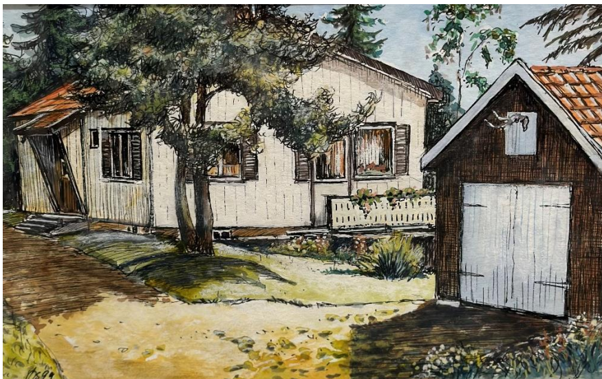
Huset på Furukollen, tegnet av Øyvind Skjærsvold

Det var en vanlig dør mellom leiligheten og postkontoret, med innerdør-nøkkel. Den låste de med en bøyd ståltråd gjennom nøkkelen.