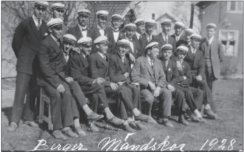
Berger Mandskor autofotografert på gruppebilde i 1928.