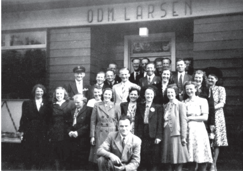
Sand sangkor.