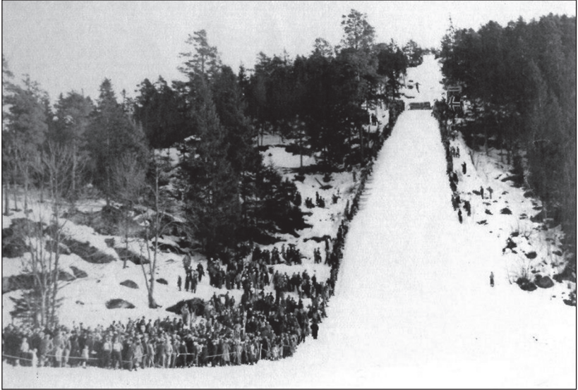
Fra et renn i Dyrdalbakken, som ble utvidet i 1937, fikk en bakkerekord på 60,5 m