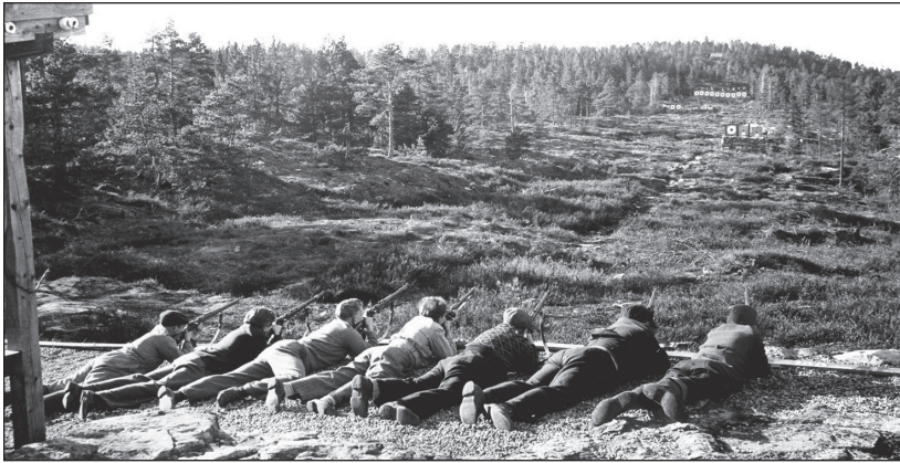
Fra Svelvik og Strømms skytterlags bane på Sand.

1853 av Gustav Adolph Lammers. Indremisjonen har alltid vært nært knyttet til Den norske kirke, men framstår som en uavhengig bevegelse.