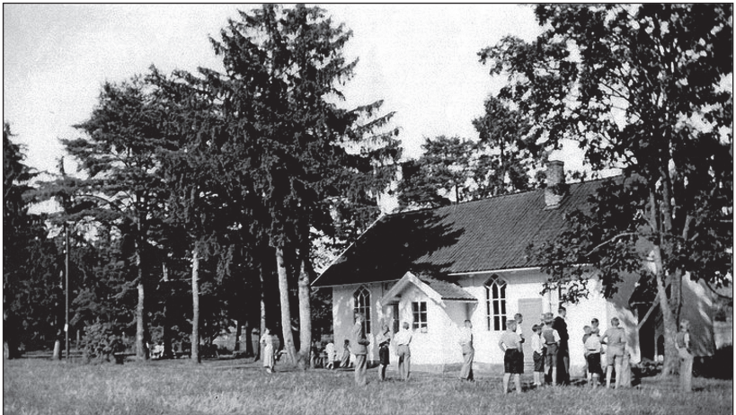
Berger bedehus 1937.

Rundt 1950-70 arrangerte indremisjonen leirskole for barn fra byen. For å få til dette ble selve taket på bedehuset løftet, og man bygde tre soverom på loftet, med til sammen 36 senger, to og to i høyden. Alt bygget på dugnad. Noen senger var korte og tilpasset de minste. Bysbarna fikk oppleve sommerferie på Berger med bibelundervisning, lek, sang, båtturer, bading og ulike arrangementer. En stor dugnadsinnsats bidro til at det ble plass til flere grupper i løpet av sommeren. I 1988 var en epoke over, og indremisjonens virksomhet ble lagt ned.