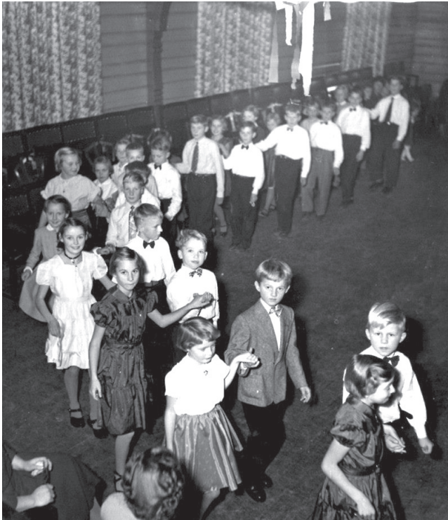
Polonese fra en oppvisning, fremført av danseskolen på Samhold midt på 1950-tallet.