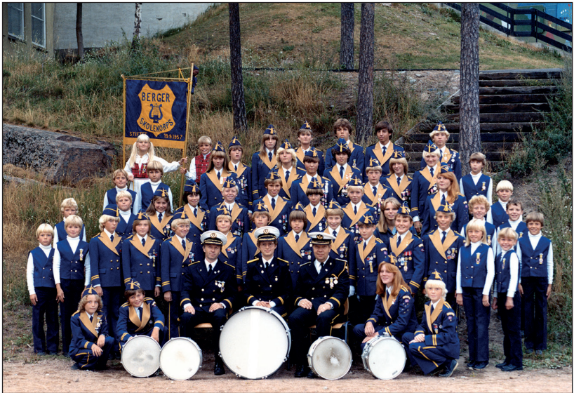
Berger skolekorps 1978.

Korpsset markerte seg ved flere anledninger, og både i 1978 og 1979 deltok Berger skolekorps på ulike stevner og tilstelninger. De var på landsdels-