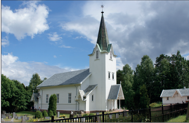
Berger kirke, slik den fremstår i dag.