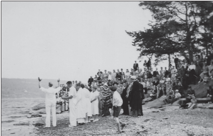
Voksendåp på Blindsandodden under krigen – i juli 1942.