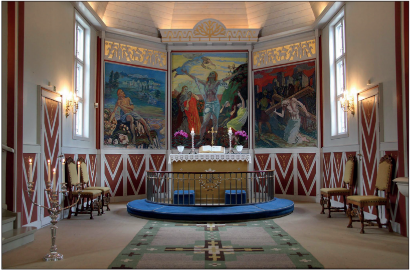
Berger kirke – altertavle malt av Axel Revold

Berger Kirkes Venner har gjennom flere år nedlagt et enormt arbeid med å ta vare på kirkebygget, bårhuset og kirkegården. Kirken er et av de viktigste av mange kulturminner på Berger og er nå i meget god forfatning takket være arbeidet som er gjennomført, delvis på dugnad og takket være midler som har blitt samlet inn av foreningen.