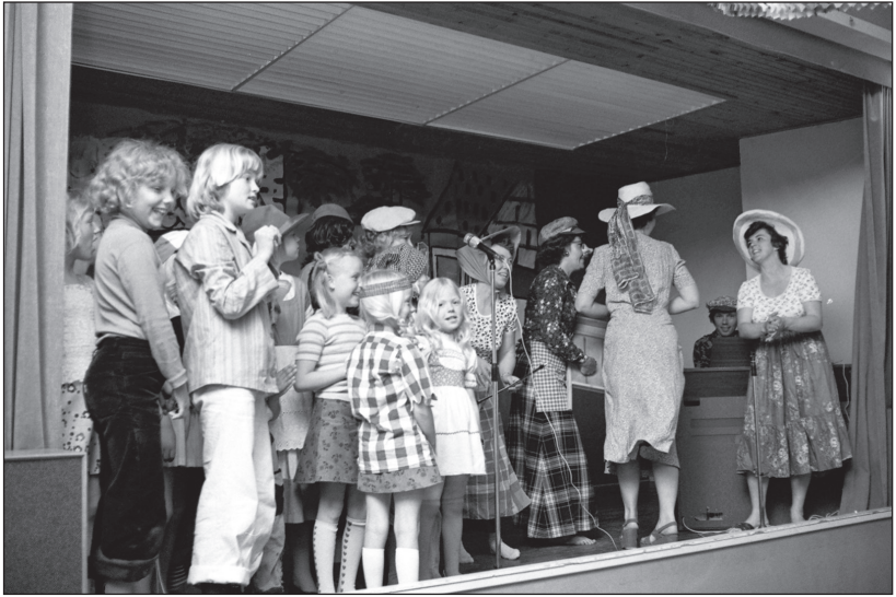
Revy på Snippen

og ble flittig brukt til møter, dåp, konfirmasjon, bryllup og juletefester. På 1960-tallet ble det også arrangert ungdomsfester på lørdagskveldene om sommeren. Dette populære arrangement hvor det kunne komme opp mot 1000 betalende.