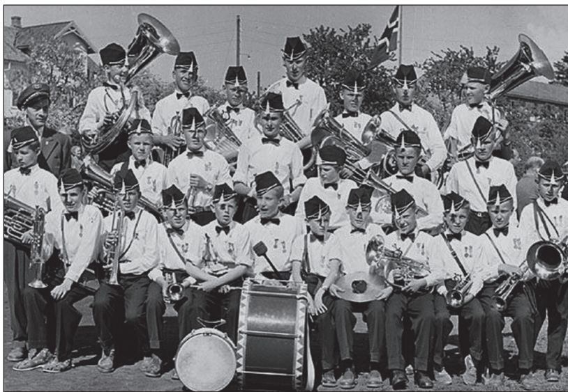
Guttemusikken på Berger i 1958.