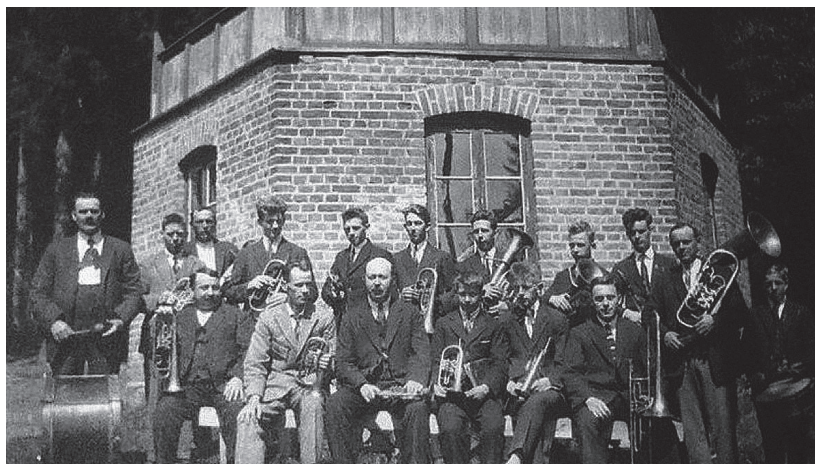
Berger Musikkorps utenfor Musikkhytta i Parken 1924.