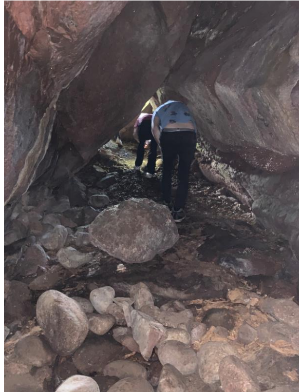
Nobelhula er 10,5 meter lang, 3 meter på det bredeste og ca.3-4 meter høy. Åpningen er ca. 1 meter bred