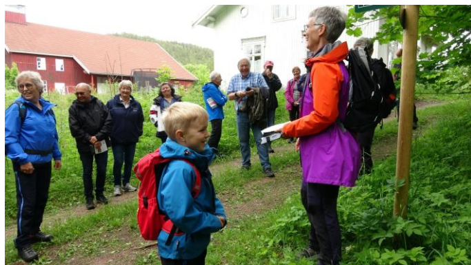
En stopp for å høre om Brekke gård. Vi var heldige og traff eieren, som fortalte mer om gården

Pokersteinen er en stor stein hvor mannfolka pleide å møtes for å spille poker og ta en øl, etter å ha fått lønningsposen. Kvinnfolka var ikke begeistret for dette – de var urolige for hvem som kom hjem uten penger, og med begrenset mulighet for å kjøpe mat påfølgende uke.