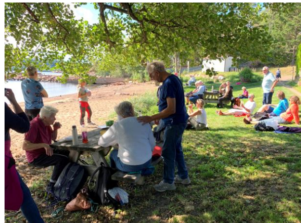
Pause i Sandvika – med «bronsealdermat»!