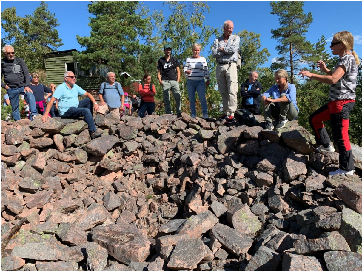
Gravrøys på Leina