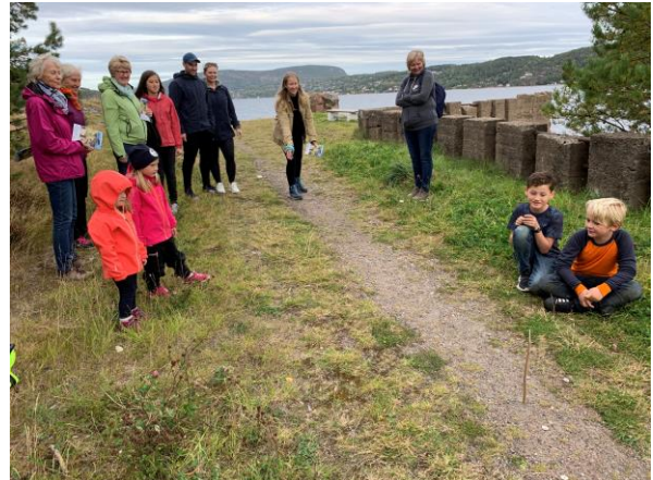
Vi kastet på stikka, slik barn gjorde før i tiden