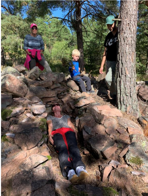
Gravkammeret passet akkurat til en voksen person