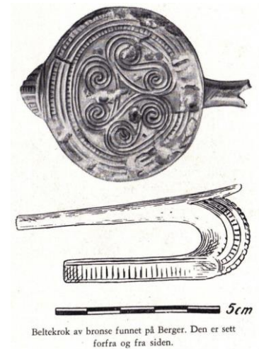
Beltekrok av bronse funnet på Berger. Den er sett forfra og fra siden.